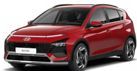
Dragon Red Pearl Perleťová Cena: 13 900 Kč