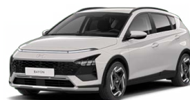
Lumen Gray Pearl Perleťová Cena: 13 900 Kč