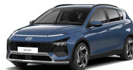
Vibrant Blue Pearl Perleťová Cena: 13 900 Kč