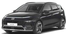
Aurora Gray Pearl Perleťová Cena: 13 900 Kč