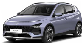
Meta Blue Pearl Metalická Cena: 13 900 Kč