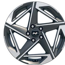
18" kola z lehké slitiny – N Line