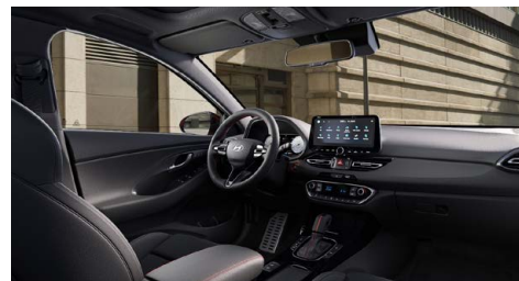
Černý interiér N line – látkové čalounění s červeným prošíváním a logem N – černé čalounění stropu a obložení bočních sloupků – červeně prošívání sportovní volant, hlavice řadící páky a loketní opěrka