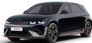
Abbys Black Pearl Perleťová Cena: 19 900 Kč