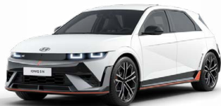
Atlas White Speciální pastelová Cena: 11 900 Kč