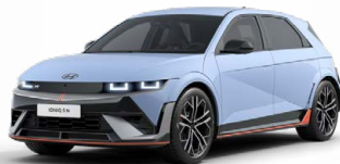
Performance Blue Pastelová Cena: 19 900 Kč