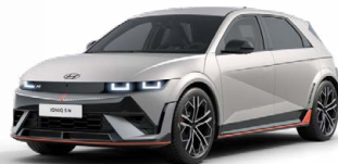
Cyber Gray Metalická Cena: 19 900 Kč