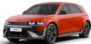
Soultronic Orange Perleťová Cena: 0 Kč