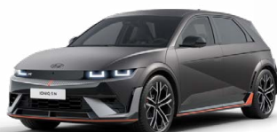
Ecotronic Gray Matná metalická Cena: 24 900 Kč