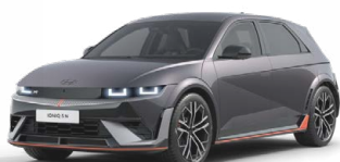
Ecotronic Gray Perleťová Cena: 19 900 Kč