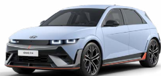
Performance Blue Matná metalická Cena: 24 900 Kč