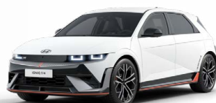
Atlas White Matná metalická Cena: 24 900 Kč