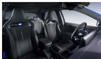
Černý interiér – čalounění sedadel Alcantara/ kůže – dostupné pro N Everyday