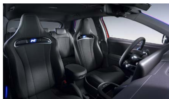
Černý interiér – čalounění sedadel kůže/látka – dostupné pro N