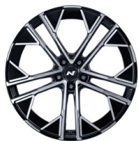
21" kovaná kola z lehké slitiny

www.porovnejhyundai.cz (Porovnejte si vozy Hyundai s konkurencí)